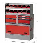
5006 E4 - Assortimento lato destro