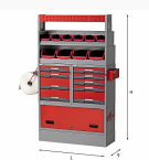
5006 E9 - Assortimento lato destro