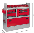
5006 EF2 - Assortimento lato sinistro