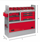
5006 C3 - Assortimento lato sinistro