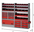
5006 E2 - Assortimento lato sinistro