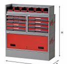
5006 E11 - Assortimento lato destro